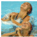
NATACIÓN SINCRONIZADA Andrea Fuentes se va con un bagaje de 36 medallas