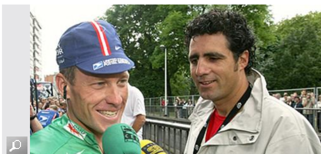
Lance Armstrong y Miguel Induráin, en Lieja (Bélgica), en el 2004.

Miguel Induráin , cinco veces vencedor del Tour de Francia , ha asegurado este martes que no cree que Lance Armstrong sea culpable "porque siempre ha cumplido todas las normas". "Hasta ahora creo en su inocencia", ha declarado a Radio Marca.